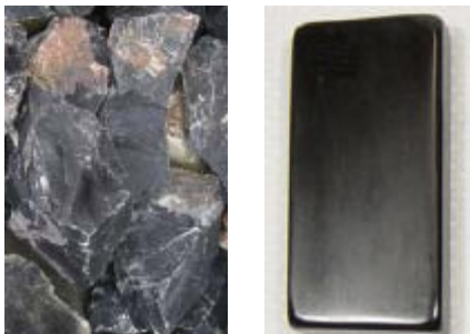
Onbewerkte en gepolijste toetssteen