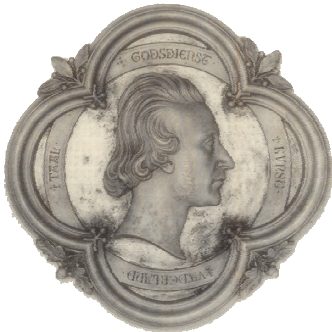
Joseph Aelbrecht Alberdingk Thijm (1820–1889): gipsen reliëf in neogotisch kader, vermoedelijk ontworpen door Cuypers

(arcam sanctificationis). Maar haar hart sprong open toen ze hoorde dat "de heilige Maagd een door God geschapen en door de Heilige Geest gevormde tent is van onvervalst purperwerk, die een nieuwe Beseleel met goud en verschillende kleuren gestikt en gespannen heeft" ( beatissimam Virginem tabernaculum esse ab ipso Deo creatum, Spiritu Sancto formatum, et purpureae revera operae, quod novus ille Beseleel auro intextum varium que effinxit ). En daar, in die tent droeg de hogepriester haar agaat als teken van één van de stammen Israels! Wat het was dat haar bond, was niet helemaal te vatten, maar het ontroerde haar dat dezelfde Beseleel die de ark had gebouwd, ook het priestergewaad had ontworpen. Nolens volens deed dit haar denken aan Cuypers die haar de ontwerpen voor kazuifels en vaandels had getoond, waarmee hij op de Wereldtentoonstelling te Parijs in 1855 zoveel succes had geogst: de nieuwe Beseleel?